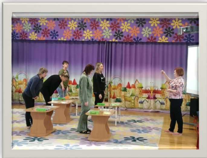
Мастер- класс «Нейропсихологические игры как средство социально- коммуникативного и познавательного развития детей»