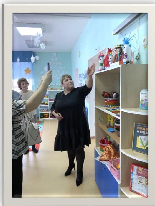
Экскурсия по детскому саду «Маленькая территория больших надежд»